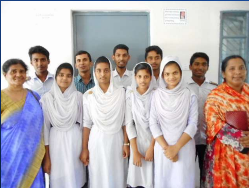
・図書館活性化プロジェクト

～ 教育こそが、未来をつくる Education Creates Futures ～