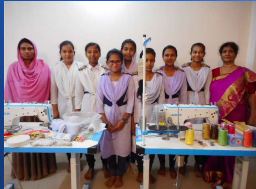
・洋裁クラブ活性化プロジェクト