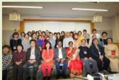
Y&Mファミリーの集い