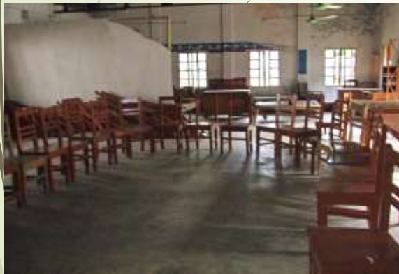
礼拝堂に大人用イスを並べて待つ