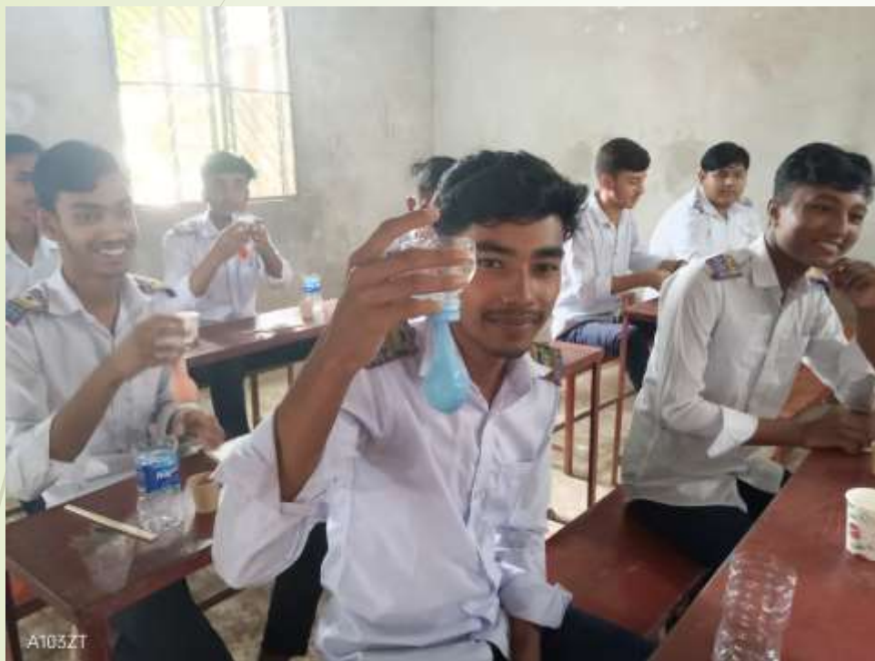
10年生に理科実験授業