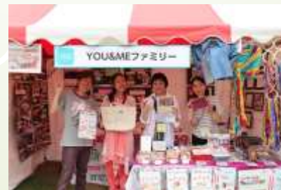
グローバルフェスタ参加