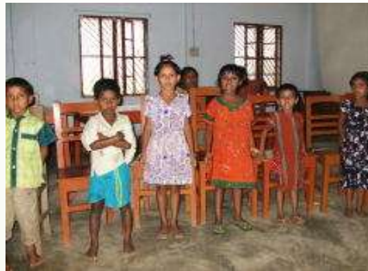
裸足で集まった子ども達