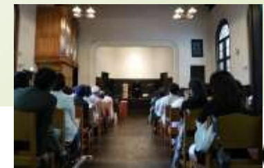
チャリティーコンサート開催